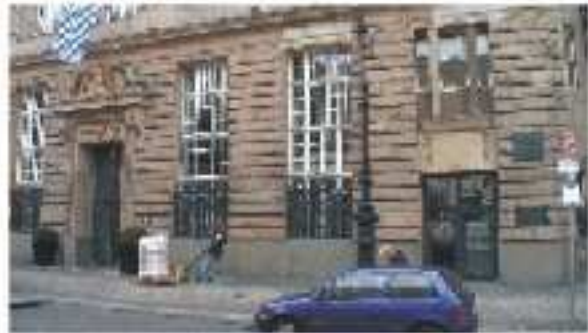
Berlin, Behrenstraße, ehemaliges Wohnhaus mit Gedenktafel

Unmittelbar südlich verläuft parallel zu Unter den Linden die Behrenstraße. Schon von weitem erkennt man an der Nummer 21 eine blau-weiße Fahne. Hier hat sich die Bayerische Vertretung in der deutschen Hauptstadt etabliert. Eine Tafel an der Fassade identifiziert aber auch das Haus als Wohnort Eulers während der meisten seiner Berliner Jahre. Natürlich sieht das Haus zu Eulers Zeiten nicht so aus wie heute. Selbst die ganze Straße entsteht erst so richtig ab 1774 im Zuge der so genannten zweiten Stadterweiterung. Da ist Euler längst wieder zurück in St.Petersburg.