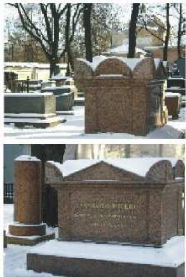
Eulers Grab in St. Petersburg

Euler verbringt zwei lange Abschnitte seines Lebens in der Stadt an der Newa, unterbrochen von einer 25 Jahre langen Zeit in Berlin. Geboren 1707 in Basel als Sohn eines reformierten Pfarrers wird er mit 20 Jahren schon nach St.Petersburg berufen in die Stadt, die 4 Jahre vor seiner Geburt von Peter dem Großen gegründet worden war. Allein schon die Reise legt Gewicht auf den Entschluss. Sie dauert damals lang. Zuerst per Schiff den Rhein hinunter bis Mainz, dann mit Postkutschen nach Lübeck, dann weiter auf der Ostsee. Die meist westlichen Winde helfen dem Vorwärtkommen. Später wird er als erster die Idee eines Radantriebes für Schiffe haben.