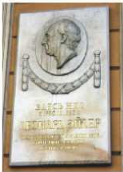
Gedenktafel am Wohnhaus