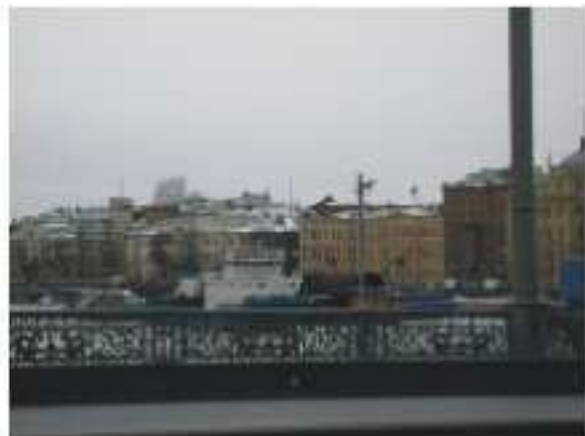
Von der Leutnant Schmidt-Brücke aus gesehen

Die Gedenktafel an seinem Wohnhaus (Leutnant Schmidt-Kai 15) auf der Wassilewski-Insel am Ufer der großen Newa nennt „Леонард Эйлер“ deshalb mit Recht einen großartigen Mathematiker, Techniker und Physiker. Unerwähnt geblieben ist die herausragende pädagogische Art, sich mitzuteilen. „Es fehlte ihm nur eine Eigenschaft zum Genie, nämlich unverständlich zu sein“, sagt Frobenius später nicht ohne Ironie. Eulers Lehrer und Förderer aus Jugendtagen, Johann Bernoulli (1667 - 1748), selbst berühmter Mathematiker, dem er über die Zeit verbunden bleibt, steigert seine brieflichen Anreden von „Hochbegabter