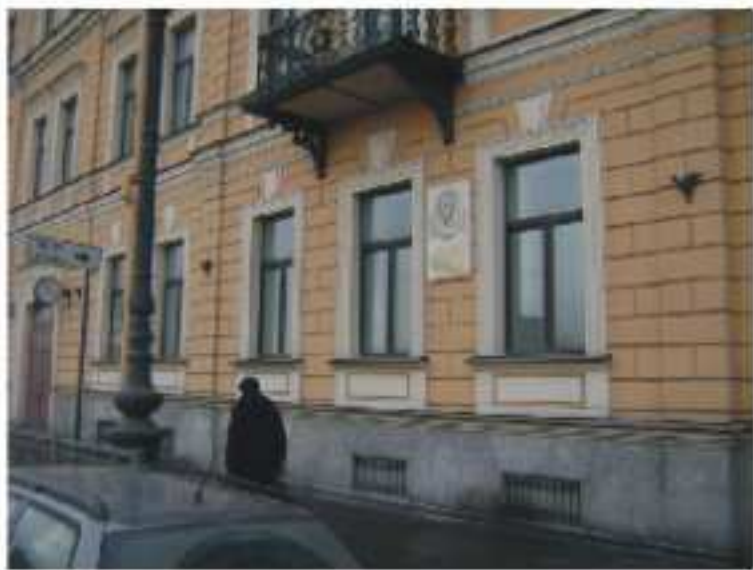
Eulers Wohnhaus am Leutnant Schmidt-Kai